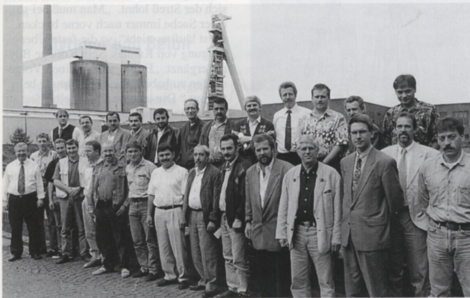
Einen herzlichen Empfang bereiteten die Mitarbeiter des Bergwerks Hugo/Consolidation den neuen Kollegen aus Hückelhofen.

Die Ruhrkohle gibt nicht nur Bergleuten von unter Tage eine neue berufliche Perspektive, sondern auch Arbeitern von über Tage, technischen und kaufmännischen Angestellten.