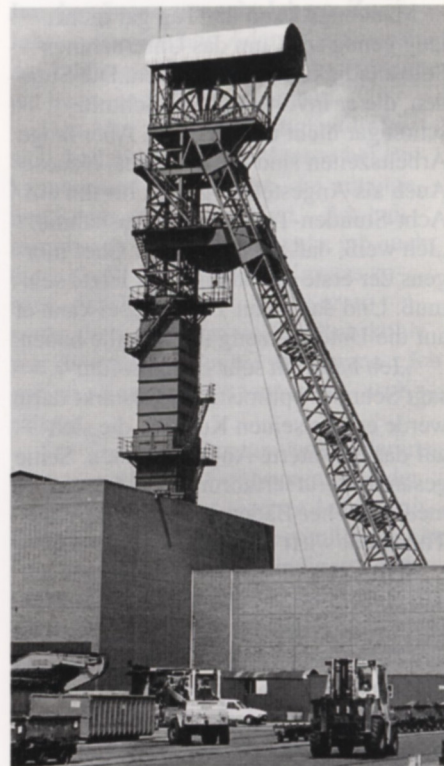
Liegt mitten im Zickzackkurs: die SJ-Schachtanlage 1/3.

Mit dem Baubeginn möchten die Verantwortlichen nicht bis zur Einstellung der Kohleförderung warten. Bereits in ein paar Wochen soll der erste Spatenstich für die Straße erfolgen. Mitte 1997 kann voraussichtlich der erste Gewerbetreibende seine Geschäfte in der erweiterten Mitte der Stadt aufnehmen.