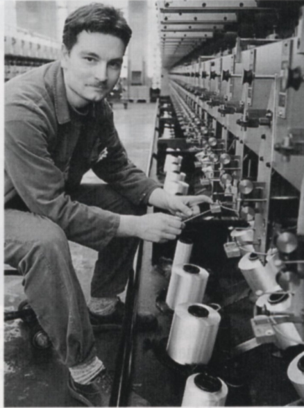
Ein Kumpel für alle Fälle: Die Qualifizierung der SJ-Mitarbeiter ist weit gefächert.