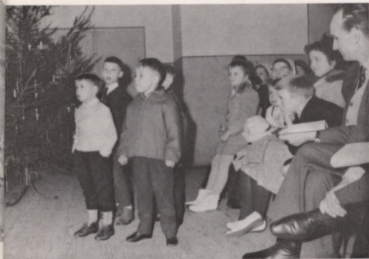
Gebannt verfolgen diese Kinder das Spiel ihrer Altersgenossen auf der Bühne