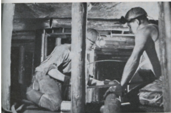
Im Lehrrevier: Ein Stempel wird zurechtgeschnitten

Bei der Auswertung der Prüfungsergebnisse kam die IHK-Aachen zu folgendem Ergebnis: „Die Volksschule und ihr Bildungsstand sind von entscheidender Bedeutung für den weitaus größten Teil aller Beschäftigten in allen Zweigen unserer Wirtschaft. Die während der betrieblichen Berufsausbildung und in den Lehrabschlußprüfungen immer wieder auftretenden Mängel im Elementarwissen (Volksschulkenntnisse) erfüllen daher die Wirtschaft mit Sorge, weil sie die planmäßige Erziehung des beruflichen Nachwuchses erschweren, ihr Leistungsvermögen beeinträchtigen und nachhaltige Auswirkungen auf die spätere Berufstätigkeit und die immer bedeutsamer werdende Weiterbildung haben.“