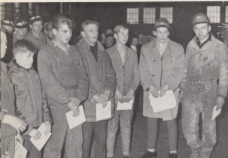
Die mit einer Bergmanns-Schallplatte beschenkten Lehrlinge

sche Weihnachtsfest unterscheide sich in vielerlei Hinsicht von den in Spanien üblichen Feiern. Trotz ihrer äußerlichen Unterschiede hätten sie aber den gleichen Inhalt. Denn im Glauben an die Botschaft des Friedens, die bei der Geburt Christi den Menschen verkündet worden sei, seien wir uns einig. Diese Botschaft zu verstehen und zu beherzigen sei eine Aufgabe, die alle Menschen verbinde.