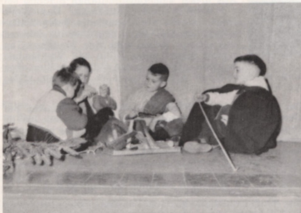
Aus dem Krippenspiel: Die Hirten auf dem Felde