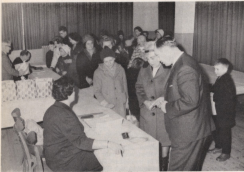
Die Bescherung der Waisenkinder