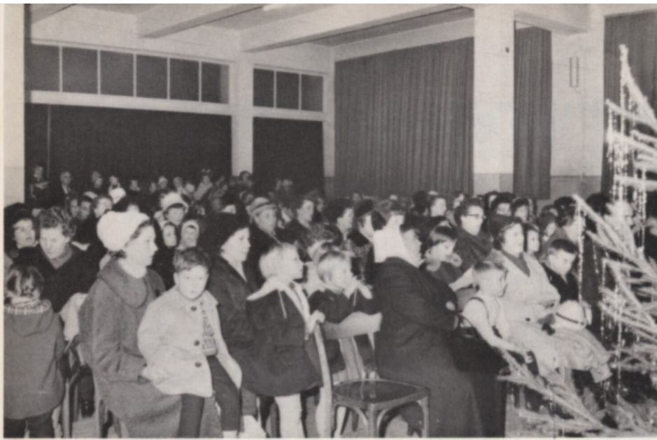
Die Besucher der Feier für die Waisenkinder