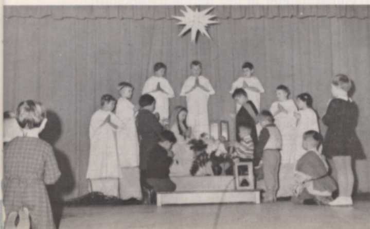
Letzte Szene aus dem Krippenspiel

Nachdem das Programm abgewickelt war, traten die Kinder mit ihren Müttern im hinteren Teil des Saales an die Gabentische, um eine große Weihnachtstüte und ein Geldgeschenk in Empfang zu nehmen.